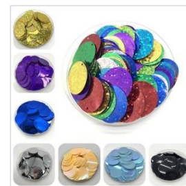
Lentejuelas grandes de sobre