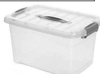
Ejemplo de cajas de 10 litros