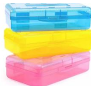
Cartuchera plástica y cartuchera de división