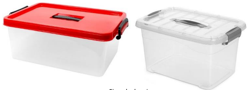
Ejemplo de cajas de 10 litros