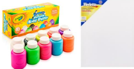
Tempera crayola de frascos y canva o lienzo para pintar