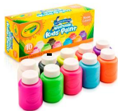
Tempera crayola de frascos y canvas o lienzo para pintar